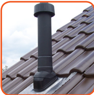
Schrägdachpfannee PP, mit Abgasrohr- dachhochführung und Wetterschutzhaube