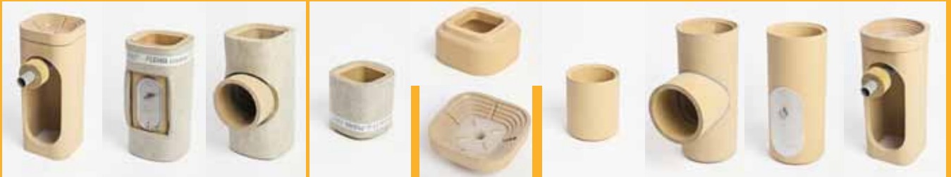
Soket borusu ara kesitli, sırsız