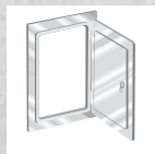
Dış kaplama için, kalite kontrol işaretli kontrol kapağı