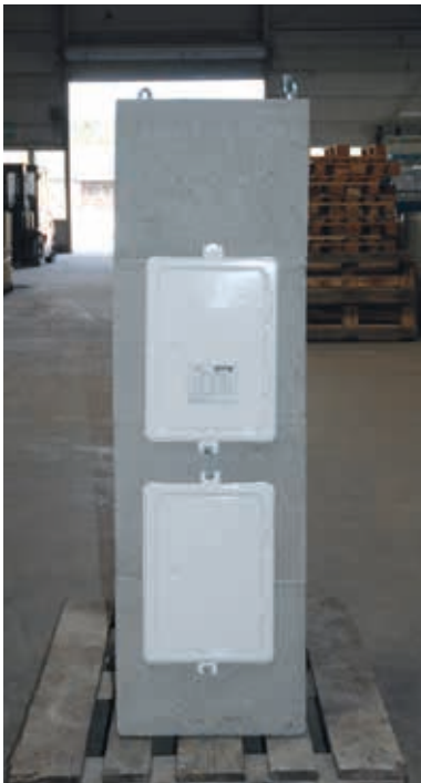
10. Fertig eingebaute Türe.