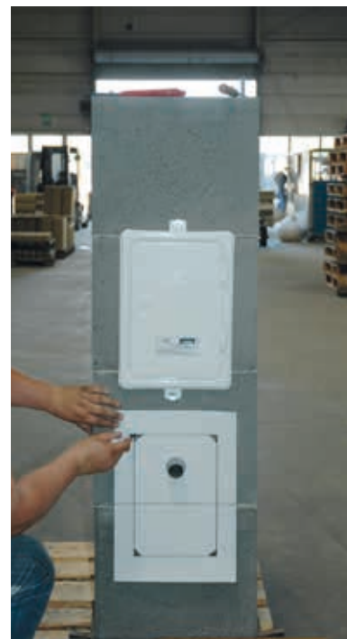
3. Ausschnitt-Ecken mit einem Stift kennzeichnen