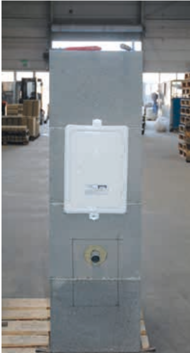
4. Angezeichnete Ecken verbinden = Ausschnitt