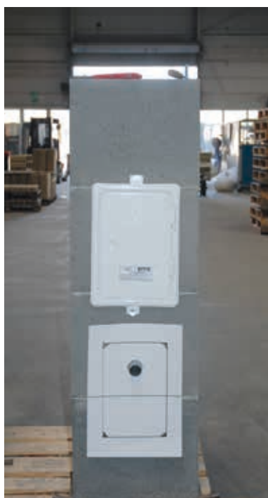
2. Schablone auf Siphonrohr aufstecken und an der Mantelsteinfuge ausrichten