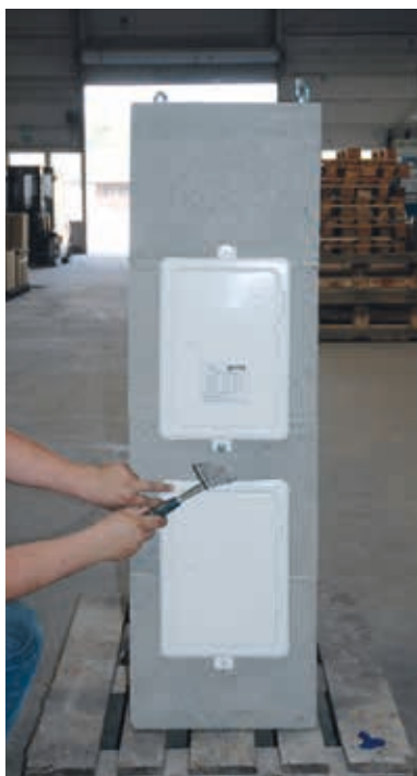
8. Türe einpassen und mit Nägeln fixieren.