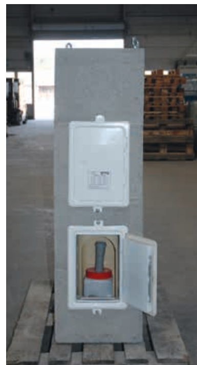
8. Türe einputzen.