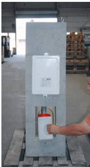
7. Kondensatbehälter einpassen. Dabei darauf achten, dass das Rohr möglichst dicht an der Sammelschale anliegt.