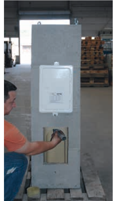
6. Nachdem die Steinstücke entfernt wurden, das Siphon entfernen.