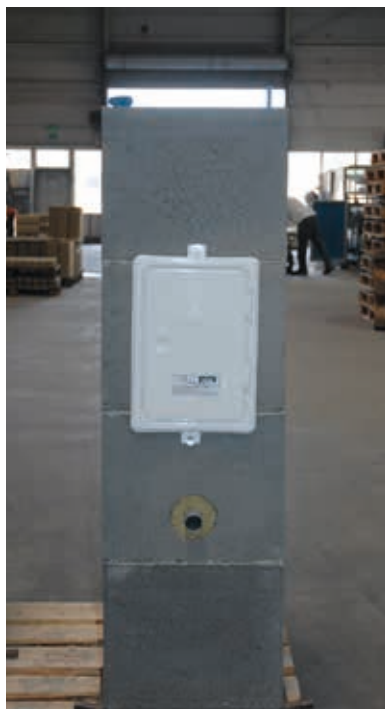
1. Fertigfuß aufstellen und ausrichten.