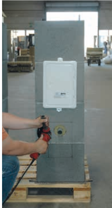
5. Mantelstein mit einem Trennschleifre entlang der angezeichneten Linien einschneiden